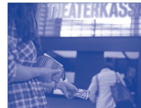
Eintritt dank KulturLegi

In unserer Gesellschaft gehört es dazu, sich etwas leisten zu können. Wer seine Freunde trifft, tut dies meist bei einem guten Essen daheim oder im Restaurant, geht mit ihnen ins Kino oder macht gemeinsam Sport. Genau das liegt kaum drin, wenn man zu den armutsgefährdeten Menschen gehört. Viele schämen sich für ihre Situation und haben Angst, die Anerkennung ihrer Freunde zu ver-